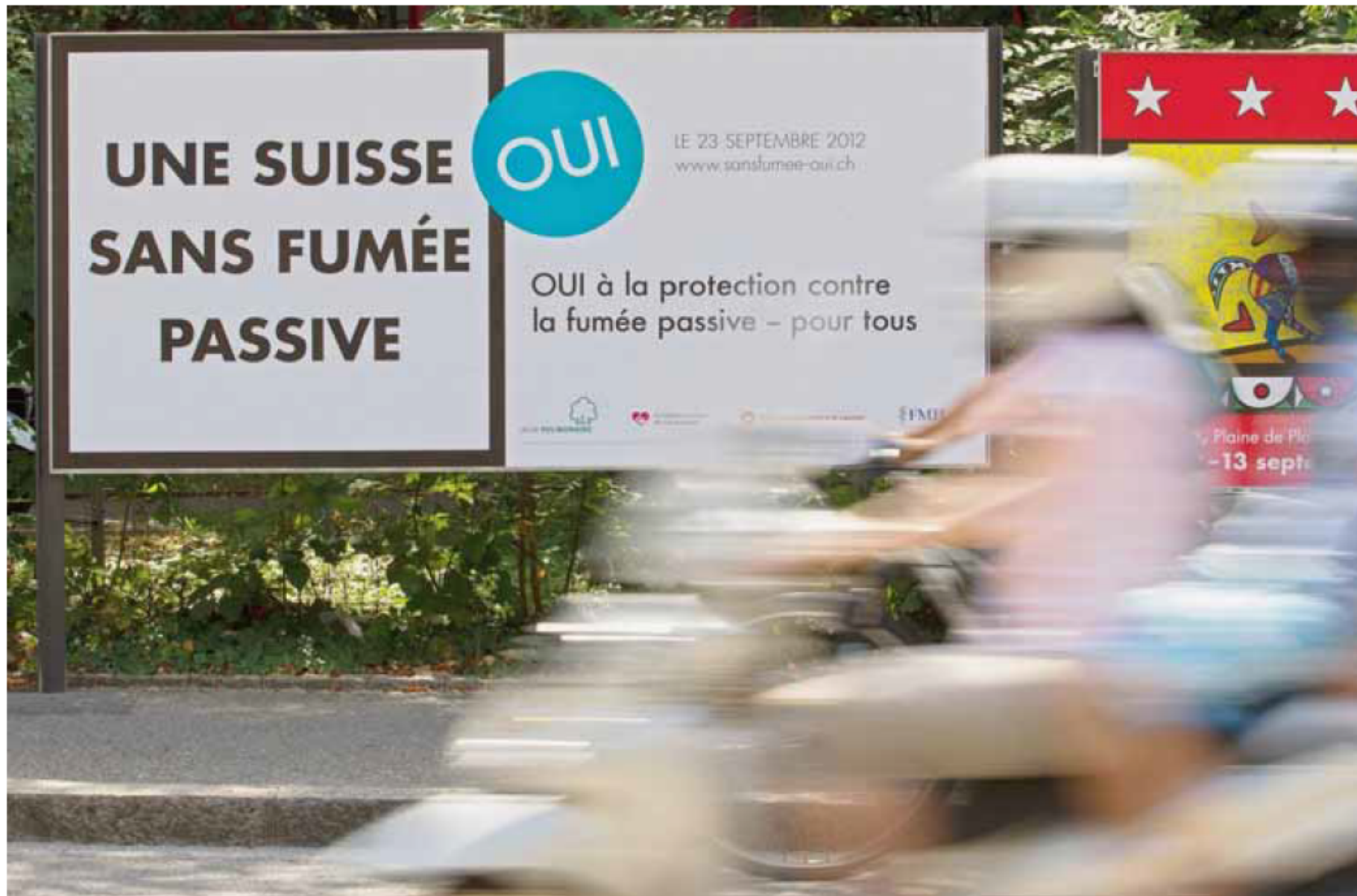
La Ligue pulmonaire investit plus d'1,5 million de francs dans sa campagne contre la fumée passive en vue des élections du 23 septembre.

«Notre position est claire: nous sommes contre l'initiative», indique British American Tobacco (BAT). La législation actuelle a fait ses preuves, renchérit le directeur de Swiss Cigarette, Thomas Meyer, dont les membres sont les trois plus importants groupes de l'industrie du tabac en